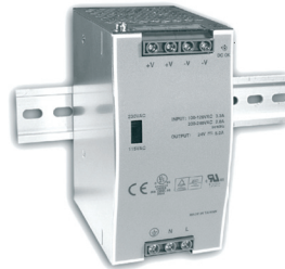
ALD 12/120 - 12V DC - 120W ALD 24/120 - 24V DC - 120W LxPxh : 66x115x125mm - 750g