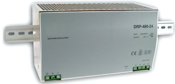
ALD 24/480 - 480W LxPxh : 227x115x125mm - 2,2Kg