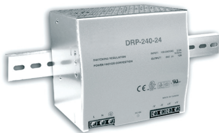
ALD 24/240 - 240W LxPxh : 125x115x125mm - 1,1Kg